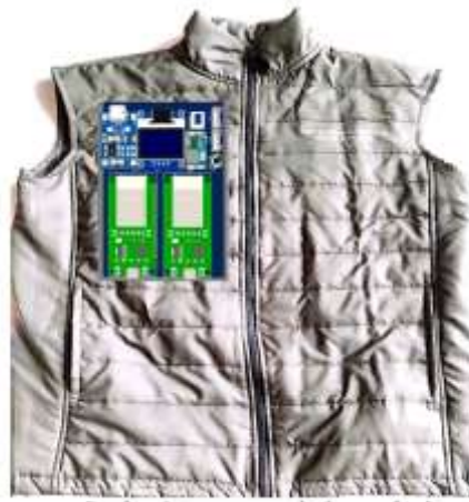
Gambar 3. Desain Rompi dengan Sensor Detak jantung dan Suhu

yang kemudian diaplikasikan pada rompi wearable sehingga pengguna dapat memakainya secara praktis. Desain ini memungkinkan pemantauan suhu dan detak jantung secara nirkabel, mendukung konsep wearable healthcare device [14], [15].