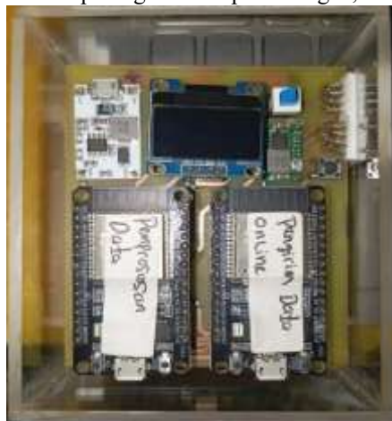
Gambar 2. Fisik perangkat hasil perancangan

Gambar 2, menunjukkan tampilan fisik perangkat hasil perancangan,