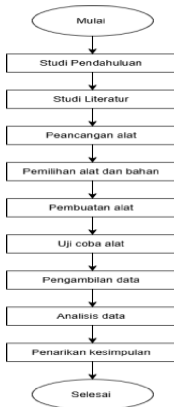
Gambar 1. Diagram alur Penelitian

Penelitian ini dilaksanakan melalui beberapa tahapan sistematis yang dirancang untuk memastikan alat pendeteksi detak jantung dan suhu tubuh berbasis Internet of Things (IoT) dapat berfungsi secara optimal sesuai dengan tujuan penelitian. Gambar 1 berikut menampilkan alur penelitian yang menggambarkan tahapan proses mulai dari studi pendahuluan hingga tahap akhir evaluasi dan kesimpulan. Setiap tahapan dalam alur tersebut dijelaskan secara rinci pada bagian ini.