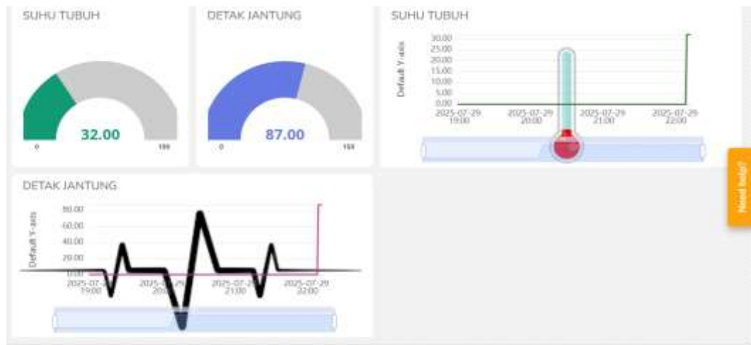
Gambar 2. Antarmuka di ubidots

Gambar 2, Diatas menampilkan antarmuka pemantauan suhu tubuh dan detak jantung yang terhubung dengan platform Internet of Things (IoT). Terdapat dua panel utama berbentuk meteran (gauge) yang menunjukkan hasil pengukuran, yaitu suhu tubuh sebesar 32,00°C dan detak jantung sebesar 87,00 BPM. Terdapat grafik suhu tubuh yang divisualisasikan dalam bentuk termometer. Grafik ini menunjukkan perubahan suhu tubuh berdasarkan waktu, dan tampak adanya kenaikan suhu secara signifikan di akhir pengukuran. Sementara itu, grafik detak jantung ditampilkan menyerupai sinyal EKG, memperlihatkan fluktuasi denyut jantung dari waktu ke waktu dengan beberapa puncak aktivitas. Di bagian akhir grafik terlihat adanya lonjakan nilai, yang menandakan peningkatan detak jantung atau batas akhir sesi pengukuran.