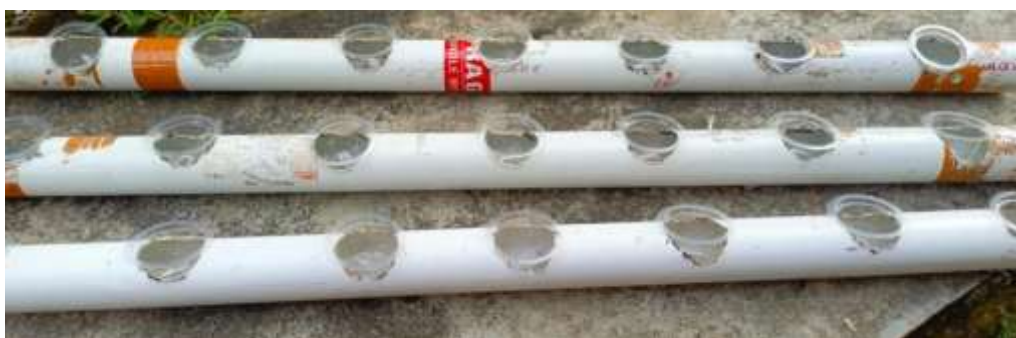
Gambar 5. Media Tanaman Hidroponik