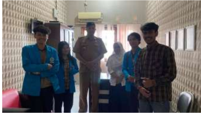
Gambar 3. Observasi dan wawancara dengan perangkat desa