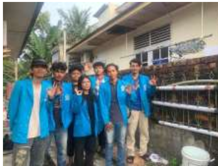
Gambar 2. Sosialisasi bersama perangkat desa dan masyarakat desa Senggarang

Sosialisasi merupakan Langkah awal yang dilaksanakan dengan tujuan untuk menjelaskan dan memperkenalkan system pengisi air otomatis menggunakan Arduino Uno kepada seluruh perangkat desa Senggarang dan seluruh masyarakat desa Senggarang. Pada kegiatan sosialisasi ini kami juga melakukan wawancara dengan perangkat desa yang ada di desa sekaligus mengambil beberapa data pendukung untuk kegiatan program seperti jumlah petani yang ada di desa Senggarang.