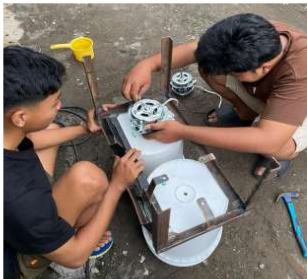
Gambar 3. Proses pembuatan alat pencacah sampah organik