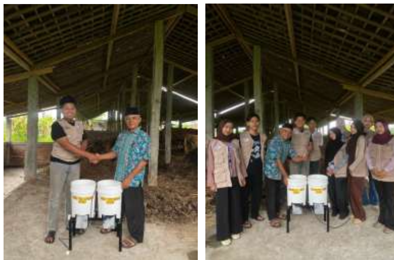
Gambar 1. Pendampingan penggunaan mesin pencacah sampah bersama perangkat Desa Greges