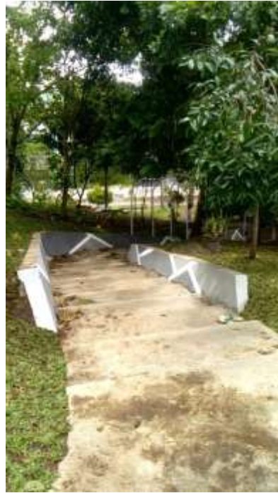
Gambar 2. Lokasi Pekerjaan Taman