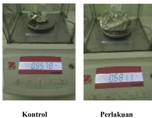
Gambar 5. Perbandingan berat kering akhir substrat kontrol dan perlakuan fermentasi ampas tebu setelah inkubasi 14 hari.