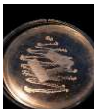
Gambar 1. Morfologi koloni isolat bakteri rizosfer Musa acuminata pada media Nutrient Agar hasil pemurnian menggunakan metode streak plate