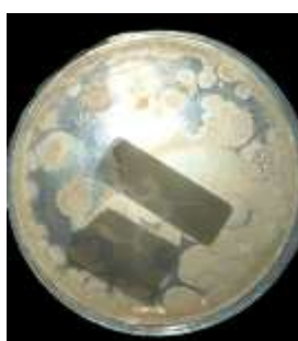
Gambar 6. Pertumbuhan koloni bakteri pada media Nutrient Agar hasil pengenceran 10^{-6}

Hasil pengujian viabilitas bakteri menggunakan metode Total Plate Count menunjukkan jumlah koloni yang dapat dihitung pada pengenceran 10^{-6} sebanyak 34 koloni dengan total populasi mencapai 3,4 \times 10^8 CFU/mL (Tabel 4). Tingginya jumlah populasi bakteri menunjukkan bahwa kondisi substrat fermentasi masih mampu mendukung pertumbuhan mikroorganisme selama masa inkubasi. Nilai viabilitas yang tinggi juga mengindikasikan bahwa isolat bakteri memiliki kemampuan bertahan hidup yang baik selama proses fermentasi berlangsung [12].