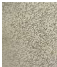
Gambar 2. Hasil pewarnaan Gram isolat bakteri rizosfer Musa acuminata yang menunjukkan sel berbentuk kokus bergerombol dan bersifat Gram positif

Hasil isolasi bakteri dari rizosfer Musa acuminata menunjukkan adanya pertumbuhan koloni dominan berwarna putih krem dengan bentuk bulat, elevasi cembung, dan tepian rata (Tabel 1). Setelah dilakukan pemurnian menggunakan metode streak plate , diperoleh kultur bakteri yang homogen dan menunjukkan pertumbuhan yang konsisten pada media Nutrient Agar. Hasil pewarnaan Gram menunjukkan bahwa isolat tergolong bakteri Gram positif dengan bentuk sel kokus yang tersusun bergerombol menyerupai buah anggur.