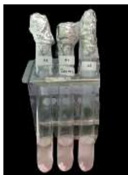
Gambar 3. Hasil uji produksi IAA menggunakan pereaksi Salkowski yang menunjukkan perubahan warna merah muda sebagai indikasi produksi IAA oleh isolat bakteri

Hasil pengujian produksi Indole Acetic Acid (IAA) menunjukkan terjadinya perubahan warna menjadi merah muda setelah penambahan larutan Salkowski (Tabel 2). Perubahan warna tersebut mengindikasikan bahwa isolat bakteri mampu menghasilkan senyawa indol yang berhubungan dengan produksi IAA secara kualitatif [7]. Produksi IAA merupakan salah satu indikator penting dalam identifikasi Plant Growth Promoting Rhizobacteria (PGPR) karena hormon tersebut berperan dalam merangsang pertumbuhan dan perkembangan sistem perakaran tanaman [8].