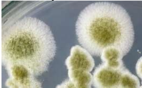
Gambar 1. Karakteristik makroskopis isolat Trichoderma sp. pada media PDA.